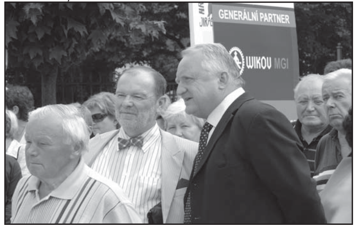
... přijeli i náměstci a hejtmani ...