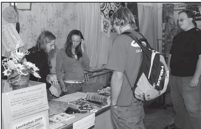
... v informačce radíme kde se najíst, složit hlavu, prodáváme vstupenky ...