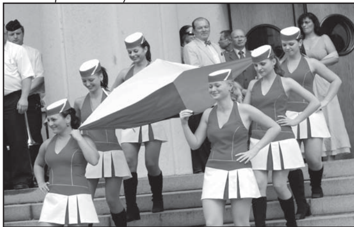
... pověsili vlajky ...