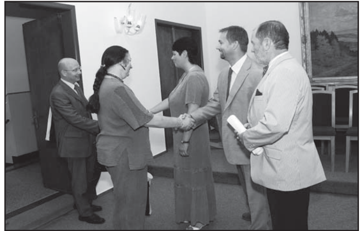
... vzácné hosty vítáme na radnici ...