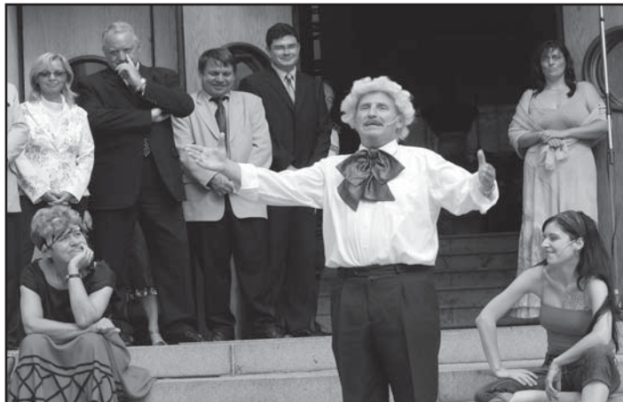
... ocenili vtipnost hronovských ochotníků ...