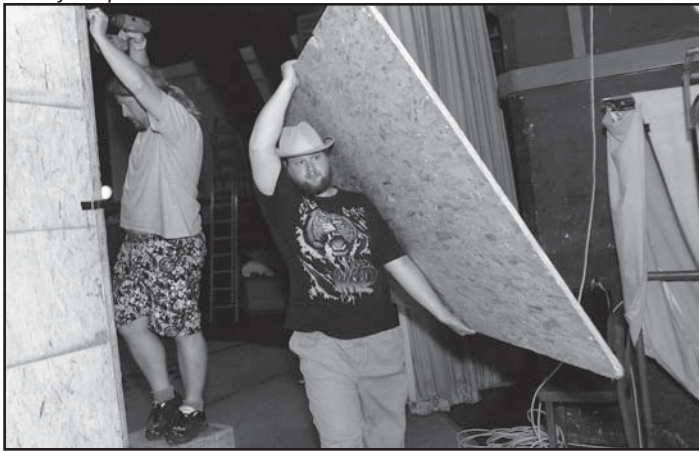
... chystáme prostory v divadle ...