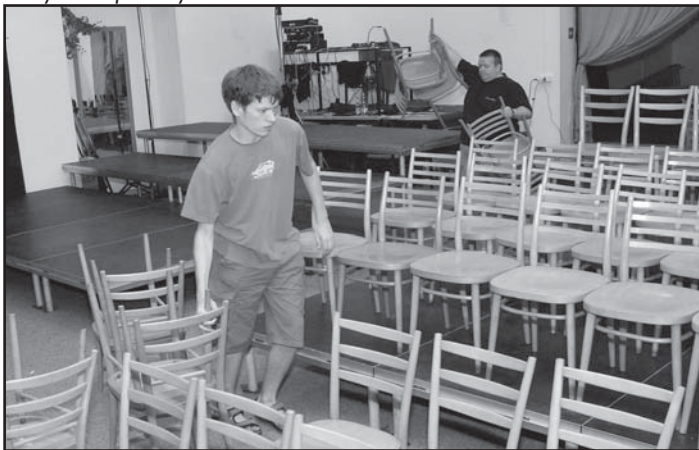
... ve Slavii ...