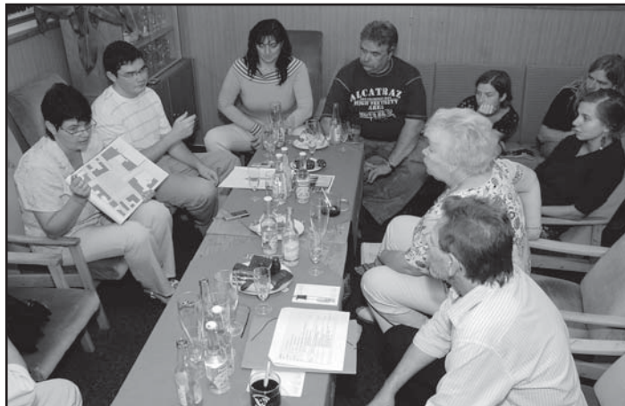
... probrat na organizačním štábu ...