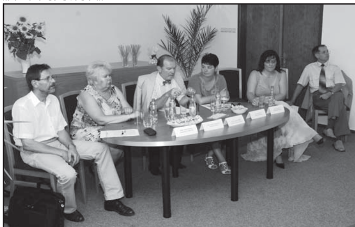
... ještě to všechno vyzvonit na tiskovce novinářům ...