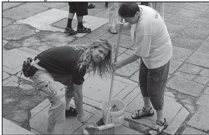
... a pak rychle poklidit před divadlem ...