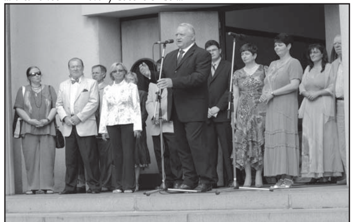
... vyslechli jsme projevy ...