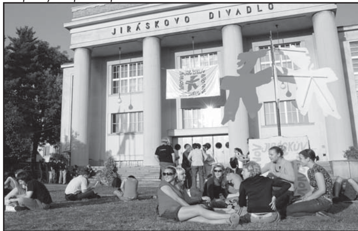
... aby se to všem líbilo ...