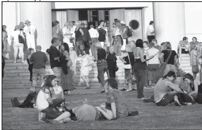
... a hurá do divadla ...