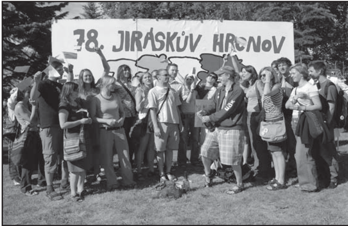
... tak jsme po roce zase U NÁS v Hronově ...