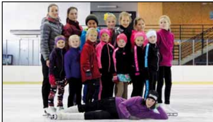
Foto závodního týmu

Za obrovskou podporu, bez které by to nešlo, děkujeme Městu Hronov a vedení HC Wikov Hronov.