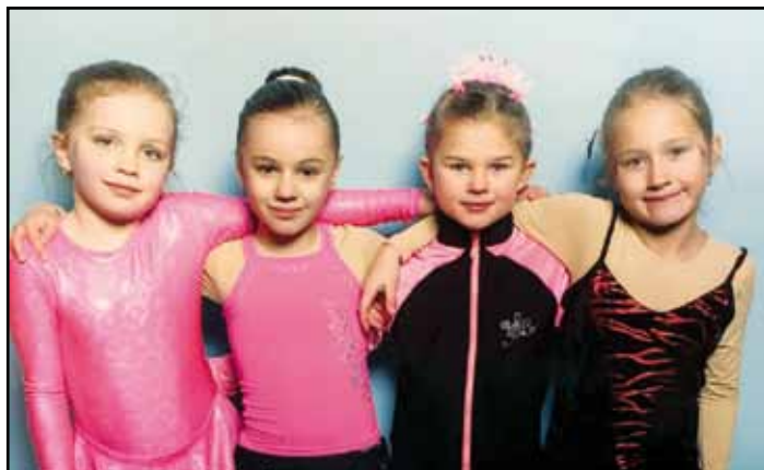
Foto ze závodů

Na závěr si mohli zabruslit i diváci. Předvedli jsme i exhibiční vystoupení pro školu bruslení v Náchodě, na hokejovém utkání na domácím ledě a na závěrečném karnevalu hronovské školy bruslení. Na konci března nám skončila závodní sezóna, ale zdaleka to neznamená, že pověsíme brusle na hřebík a budeme lenošit. Na jaře nás čeká pár hodin na leď v Hradci Králové, v létě pak soustředění v Příbrami a v Náchodě. Abychom do nové sezóny naskočili ve skvělé formě, budeme celé jaro trénovat gymnastiku, atletiku, budeme si hrát a tančit. A hlavně se budeme těšit na září, kdy se zase pořádně obujeme do bruslí a budeme sbírat další cenné kovy. Doufáme také, že se k nám připojí nové děti a náš závodní tým se zase rozroste.