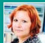
Klára Němečková moderátorka