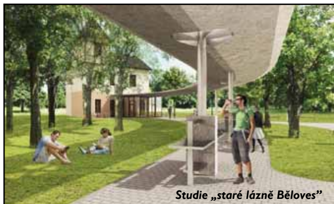
Studie „staré lázně Běloves“

V první řadě je třeba upřesnit, že se nejedná o obyčejný nerezový plech, ale o potravinářskou nerezavějící ocel, která se používá např. v gastronomii mimo jiné pro svou snadnou čistitelnost a odolnost vůči usazeninám. Prameník tedy lze čistit a navrátit mu tak vždy původní vzhled, aniž by došlo k jeho trvalému poškození. Na přiložených obrázcích můžete vidět, že použití nerezového plechu není žádnou hronovskou raritou, ale nejčastějším řešením, např. na většině prameníků v Mariánských Lázních. Jako velmi nevhodné se z těchto důvodů jeví použití kamene, který na sebe