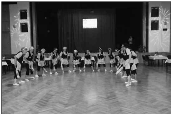
Ženy tam předvedly skladbu „Bábinky“ a tím přispěly k dobré pohodě.

a také Sokol Hronov přispěl svou troškou k této oslavě.